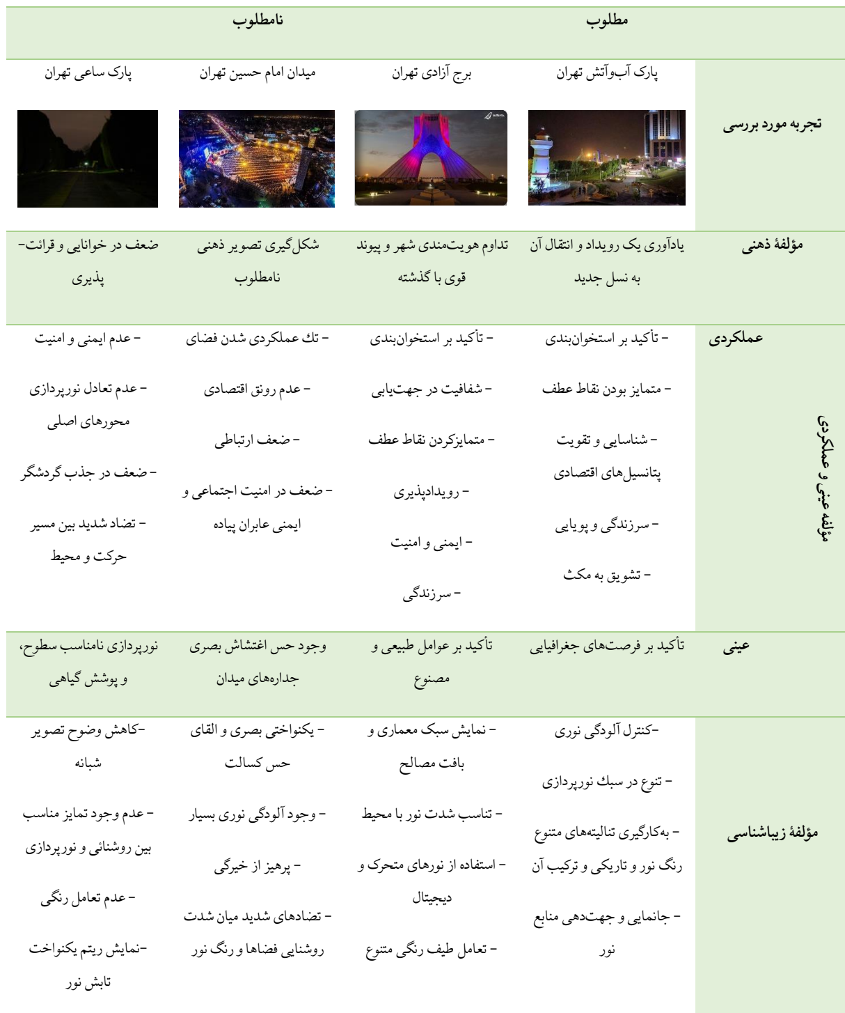
جدول ۳: تحلیل تجربه‌های پیرامون منظر شبانه