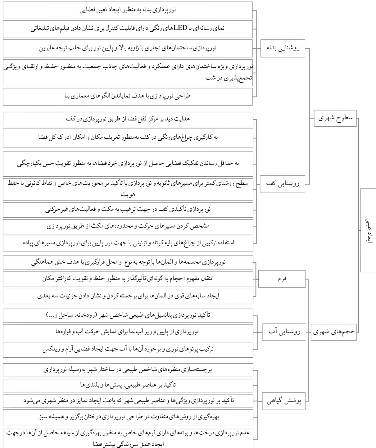
نمودار ۲: اصل‌ها و معیارهای مؤلفه عینی حیات شبانه

نورپردازی از پایین و زیر آب‌نما برای نمایش حرکت آب و فواره‌ها بهره‌گیری از روش‌های متفاوت در طراحی نورپردازی درختان برگزیر و همیشه سبز.